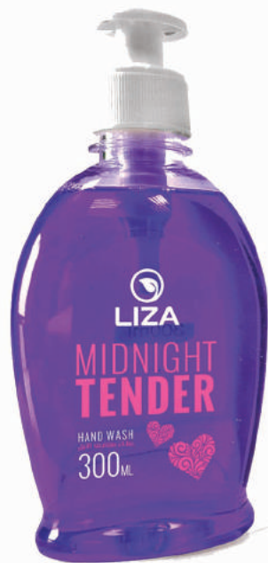
Tendresse de Minuit